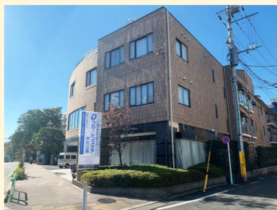
フローレンスケア 芦花公園 外観

東京・神奈川にて13の施設を運営する工藤建設株式会社の介護付き有料老人ホームをご紹介します。リハビリ強化型、医療強化型、認知症強化型などそれぞれのホームで特色があり、今回はリハビリ強化型の「フローレンスケア 芦花公園」の見学に行ってきました！